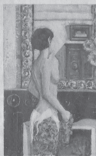
Staand model/reflectie, 2010